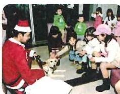
アニマルヒーリング

デリバリーとは配達という意味の他に「分娩」という意味があります。当院の看護師・助産師チームによるハンドベルの演奏です。日夜苛酷な勤務の合間に練習した成果、どうか心に響きますように。「命」を届けるのが私達の仕事です。